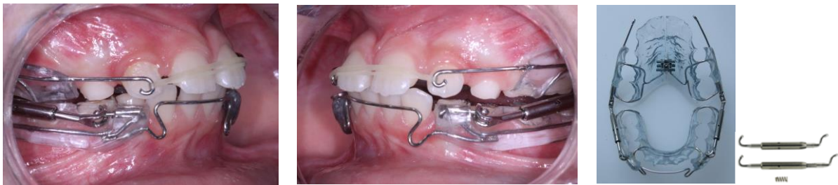
Pose PUL 2

Prescription : PUL 2 (vérin d'expansion maxillaire + élastique antérieur + arc de redressement des incisives inférieures)