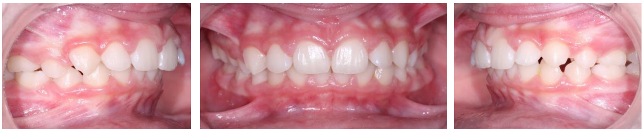
Harmonisation 4D : fonctionnelle, sagittale, transversale et verticale