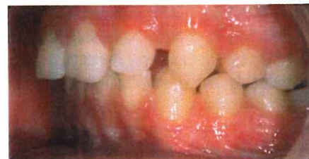
PUL + 3 mois (mars 2012)