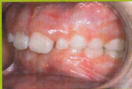
Avant le PUL

Prescription : Dégagement des voies aériennes supérieures par l'ORL et harmonisation 4D par PUL avec vérin 3D au maxillaire.