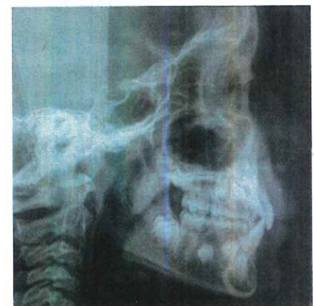
Photos téléradiographies avant et après