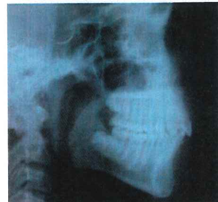
Téléradiographies avant et après l'action du PUL