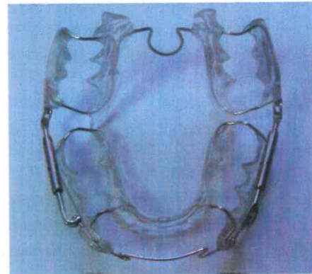
Photos PUL en bouche